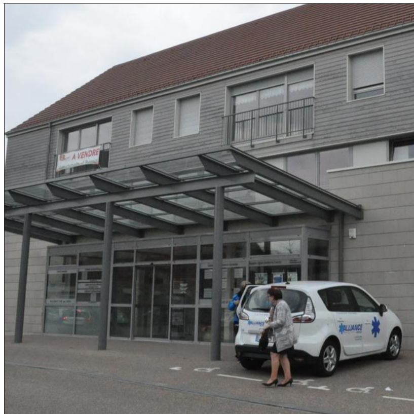
À gauche, ce sont les salles d'attente de la maison de santé de Bartenheim, en Alsace. À droite, voici l'extérieur de du pôle de santé de Schirmeck.

Un pôle de santé pluridisciplinaire est en construction à Beaune. Reportage en Alsace, dans des structures conçues par le même bureau d'étude, PS Concept.